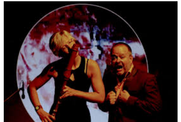
Duo UMS 'n JIP

ArteScienza progetta e co-realizza opere, spettacoli, iniziative culturali con Enti ed Istituzioni culturali internazionali, Accademie, Conservatori e altre Istituzioni dedite alla formazione, apre gli spazi della vita quotidiana (ambienti di lavoro, spazi aperti), alla musica e all'arte, trasformandoli da luoghi ordinari in luoghi straordinari, presenta al grande pubblico forme d'arte integrate che si adattano all'ambiente, al contesto architettonico e urbano, rendendo emergenti i collegamenti storici, sociali e culturali che le caratterizzano