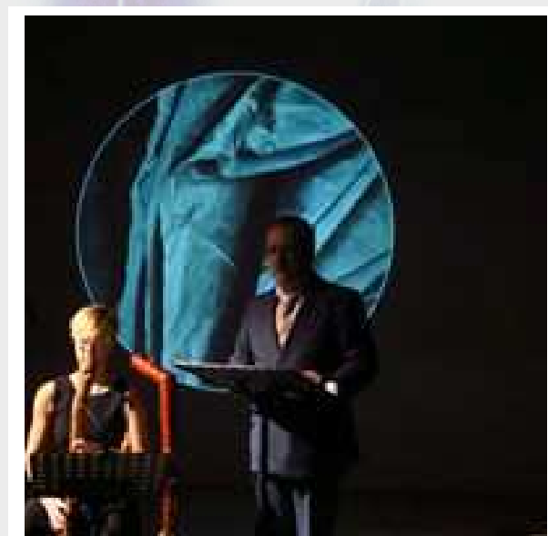
Duo UMS 'n JIP